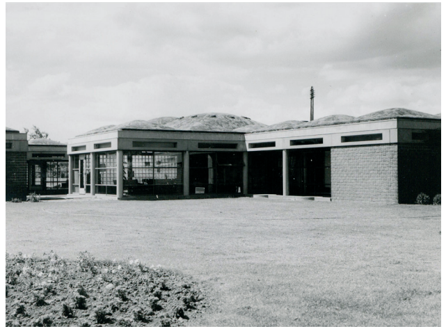
Resim 9, Resim 10, Resim 11, Resim 12. Amsterdam Yetimhanesi.

malzemelerle ve sokak aydınlatmasıyla üzerinde çatısı olan bir sokak olarak tasarlanır (van Eyck, 1962/1999, 89).