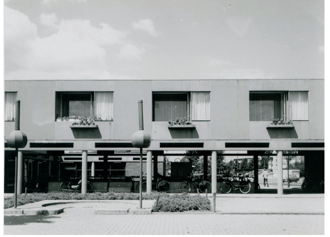
Resim 13, Resim 14. Amsterdam Yetimhanesi açık meydanı ara alan olarak tasarlanmıştır.

kurabileceği, uzlaşabileceği ve ikiz fenomen haline gelebileceği ortak bir zemin sağlar.