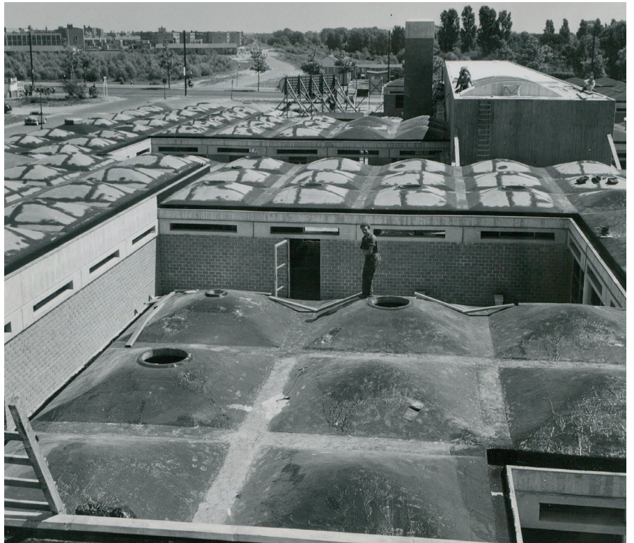
Resim 15. Amsterdam Yetimhanesi'nin kubbeleri.

Van Eyck'in geliştirdiği ara alan kavramının gözden geçirilmesinden ortaya çıkan en önemli bulgulardan birisi, ara alanın, yalnızca insanlar arasında