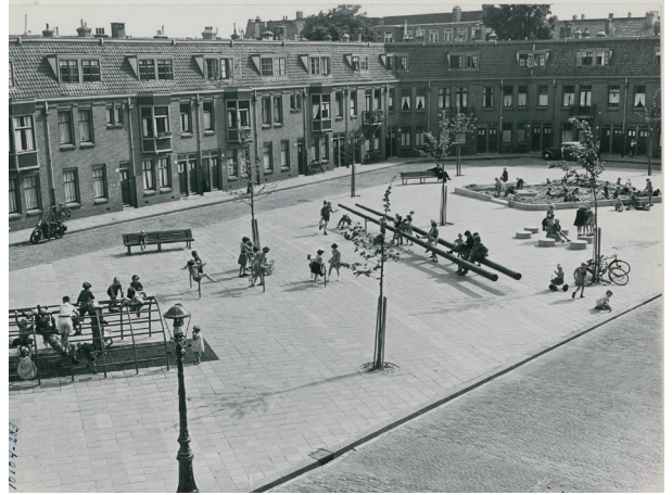
Resim 7, Resim 8. Transvaalplein oyun alanı, öncesi ve sonrası.

Eyck; 1947 ile 1970 yılları arasında, hemen her mahalledeki boş arazilere yahut unutulmuş alanlara, boş yer olmayan mahallelerde ise İkinci Dünya Savaşı sırasında tehcir edilen insanların evleri yıkılınca boşalan arsalar ve artık alanlara 700'den fazla oyun alanı tasarlar (van Eyck, 1999, 68, 70) ( Resim 3 - Resim 8 ). Bu oyun alanlarını tasarlarken, bir katalogdan alüminyum fil veya zürafa gibi oyun alanı ekipmanlarını seçmek yerine çocukların üzerine veya altına oturabileceği ve çeşitli biçimlerde kullanabileceği kubbe, iglo veya kemer gibi şekilleri kullanır (van Eyck, 2008, 115). Çocuklara bu tür ekipmanları deneyimleme fırsatı yaratarak çocukların eylemleri aracılığıyla mekâna katılım sağlamalarını ve mekanı yere dönüştürmelerini sağlar. Oyun alanları sadece çocuklar tarafından değil aynı zamanda gençler ve yetişkinler tarafından da kullanılabilirdiği için farklı yaş grubundan insanları bir araya getirerek kutuplara bir zemin sağlayan ve herkes için yer sağlayan ara alan olarak görev yaparlar.