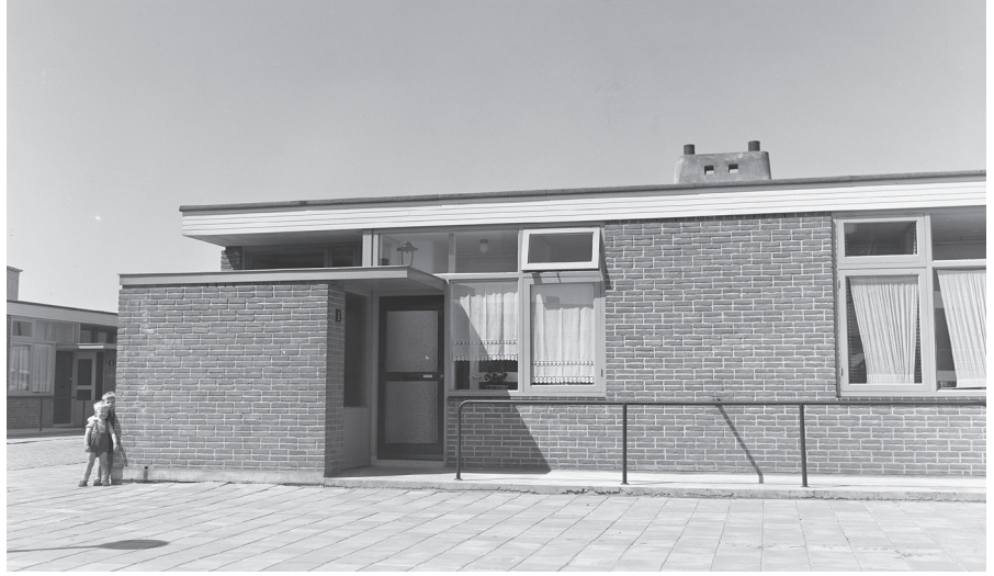
Resim 2. Van Eyck ile Jan Rietveld'in yaşlılar için tasarladıkları evlerin ( The Houses for the Elderly ) önlerindeki trabzanlar yer örneği teşkil eder (Stadsarchief Amsterdam, arşiv kayıt no: 5293FO006211).

Van Eyck'in mimari düşüncesinde; insanın mekândaki varlığı, deneyimi ve etkinliği mekânı yere dönüştürür. Dolayısıyla insanın deneyimi esastır ve insanın katılımı değerli kabul edilir. Burada belirtmek gerekir ki mekân ve yer arasındaki ayırım 1960'ların başında yaygın değildir; ancak "van Eyck bunları altmışlı yılların ortalarında geliştirdikten kısa bir süre sonra mimari düşüncenin ticari sermayesinin bir parçası haline gelmiştir" (Strauven, 1998, 471).