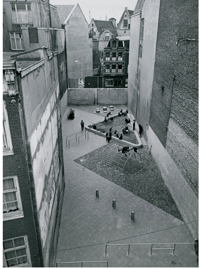
Resim 3, Resim 4. Dijkstraat oyun alanı, öncesi ve sonrası.