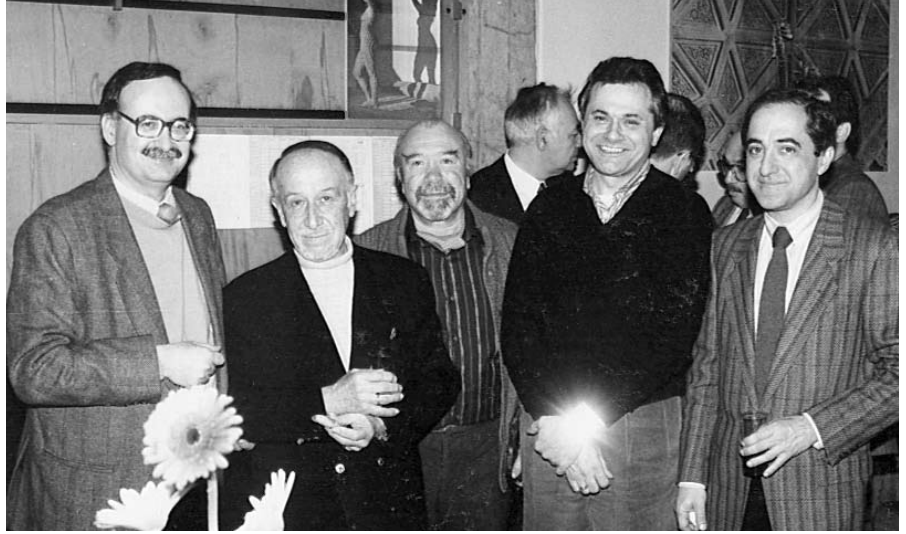
**Dr., ODTÜ Modern Diller Bölümü.