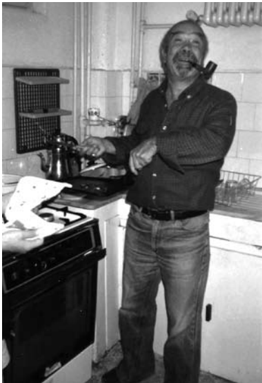
*Prof. Dr., ODTÜ Metalurji Mühendisliği Bölümü.