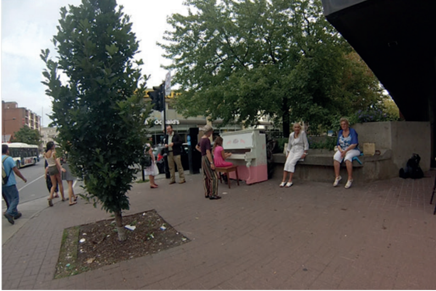
Côte-des-Neiges metro istasyonu çıkışında dileğenin çalabildiği bir piyano. Metro Çıkışı, Montréal, Kanada.