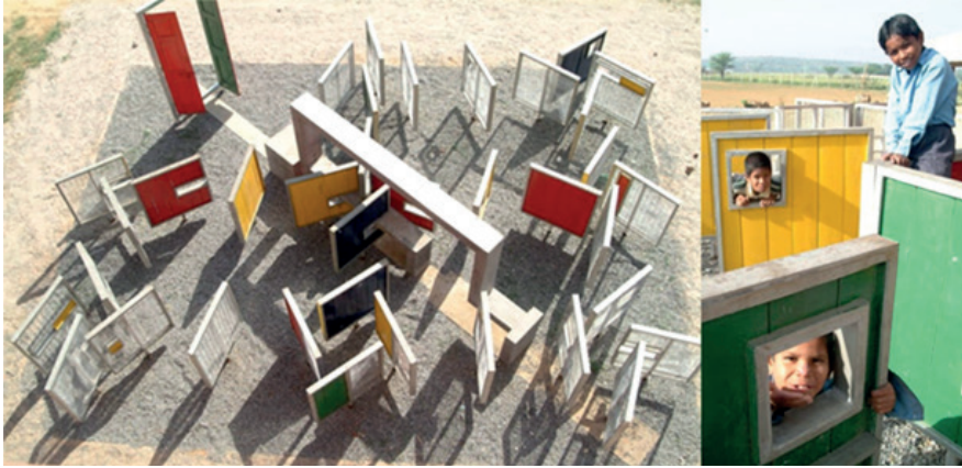
Geometrik şekillerle oyun parkı. Haryana, Hindistan.