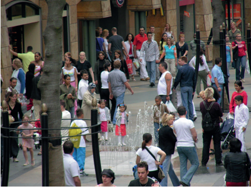
Kent meydanı haline getirilmiş yaya geçidinde su ögesi. Rotterdam kent merkezi alt yaya geçidi, Hollanda.