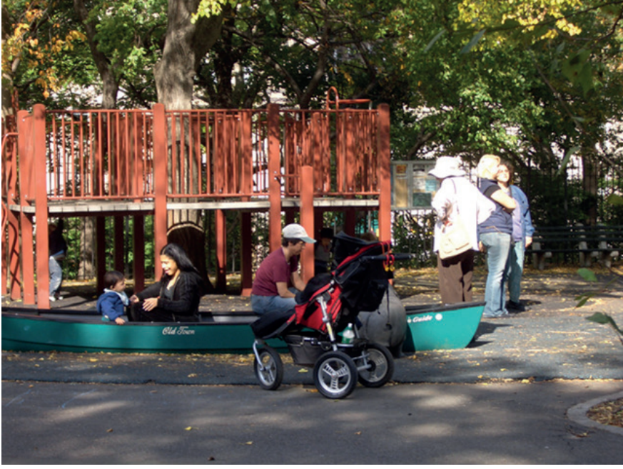
Ağaç ev. Hippopotamus Çocuk Parkı, New York, ABD.