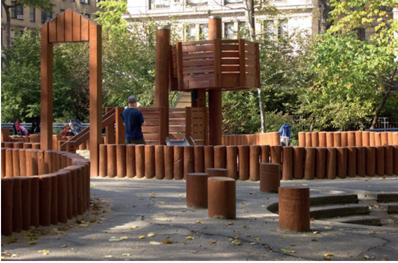
Erişilebilir ve geçiş sağlanabilir alt alan sınırları. Ahşap Çocuk Parkı, Central Park, New York, ABD.