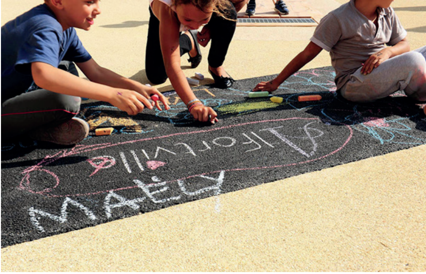
Yere resim yapma imkanı veren oyun parkı, Alfortville, Fransa