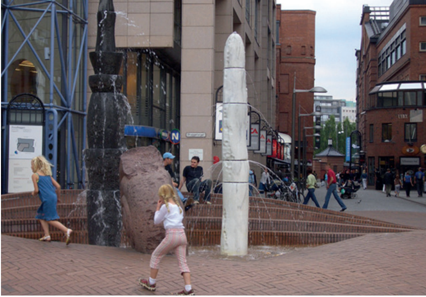
Çoklu kullanım alanı ortasında meydanlaştırılmış sert zeminde su ögesi. Oslo, Aker Brigge, Norveç.