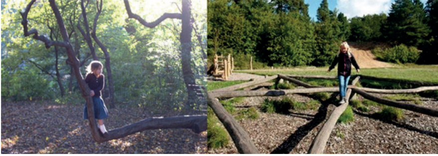
Doğal tırmanma ve oyun ögesi olarak ağaç. Central Park, New York, ABD.