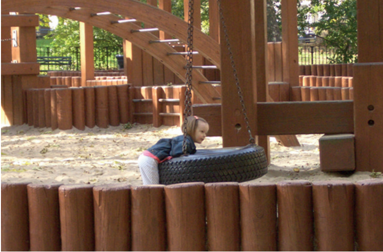
Doğal öğelerle tasarlanmış, çocuk için algılanabilir alt alanları olan oyun bahçesi. Central Park, New York, ABD.