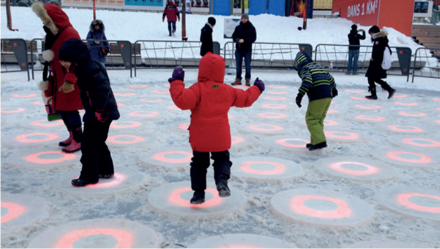
İşık ve ses deneyimleme sergisi, Luminothérapie, Place des Arts Kent Meydanı, Montréal, Kanada.