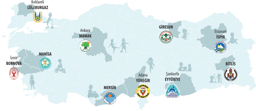
Şekil 2. UNICEF Türkiye'nin Çocuk Dostu Şehirler ve Toplumlar Girişimi'n ilk olarak başladığı 10 belediye

ilk çalışmadan çıkarılan dersler ışığında, UNICEF Türkiye Ofisi, ülke programında benimsenmek üzere “Çocuk Dostu Şehirler Girişimi” çerçevesini hazırlamıştır. Bugün, UNICEF Türkiye Ofisi, çalışmalarını İçişleri Bakanlığı ve Belediyeler Birliği gibi stratejik ortaklarla yürütmektedir.