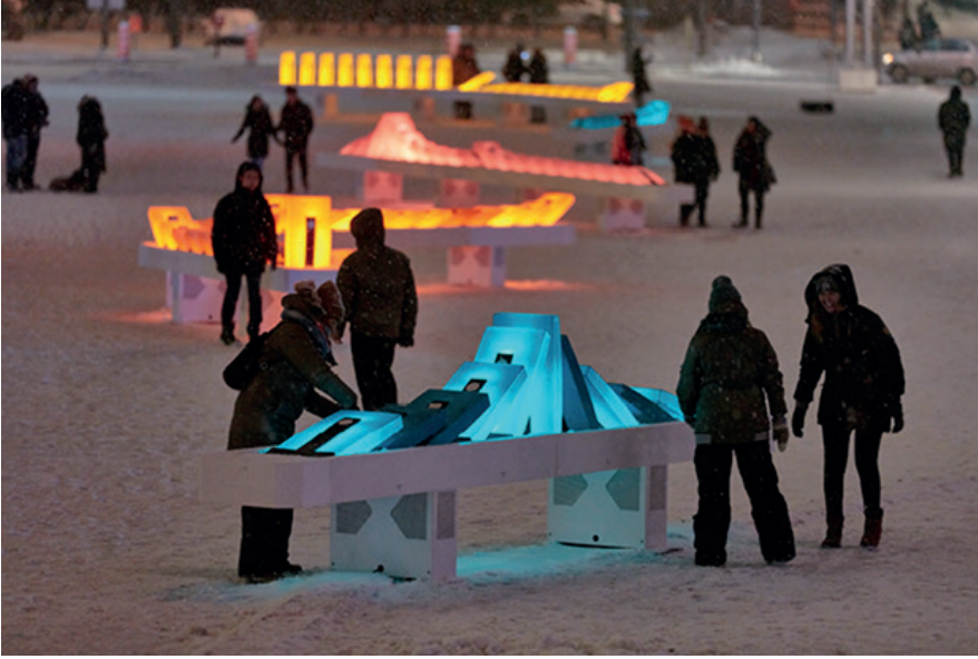
İşık ve ses deneyimleme sergisi, Luminothérapie, Place des Arts Kent Meydanı, Montréal, Kanada.