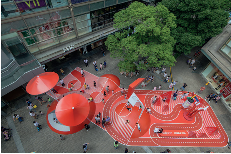
Kent meydanında kırmızı planet oyun sahası, Şanghay, Çin.