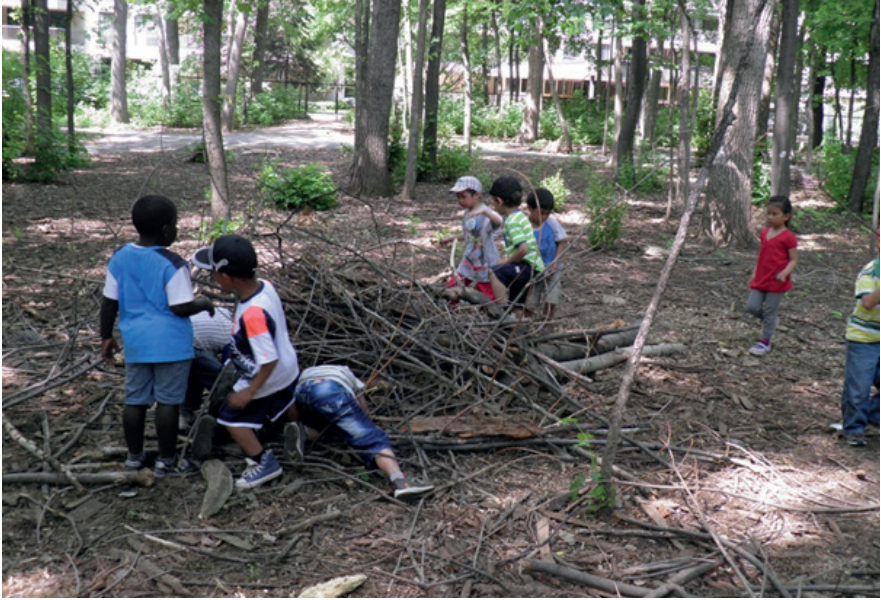
Sadece doğal öğelerden oluşan çocuklar için macera ve yaratıcı oyun imkanı sunan mahalle içi küçük orman. Côte-des-Neiges Mahalle Ormanı.