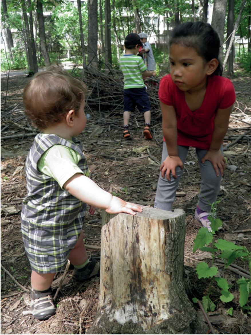
Doğayla temas. Côte-des-Neiges Mahalle Ormanı.