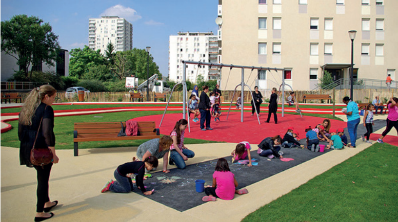
Yere resim yapma imkanı veren oyun parkı, Alfortville, Fransa