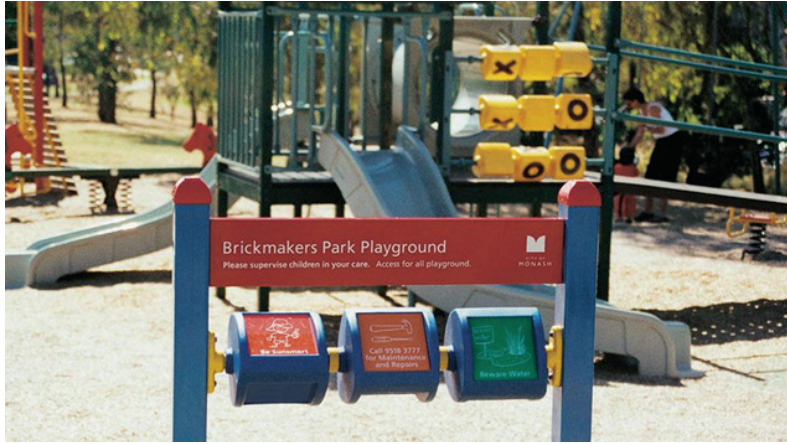
Çocukların sağlık ve güvenliği için yönlendirici işaret levhaları. Brickmakers Parkı, Monash, Avustralya.