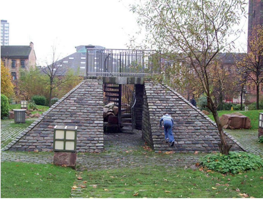
İnsan yapımı tırmanma ögesi, Oslo, Norveç.