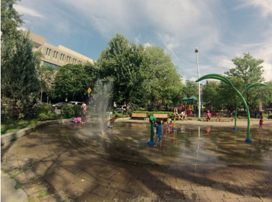
Şaşırtıcı ve merak uyandıran su öğeleri içeren çocuk parkı. Côte-des-Neiges Mahalle Parkı. Montréal, Kanada.