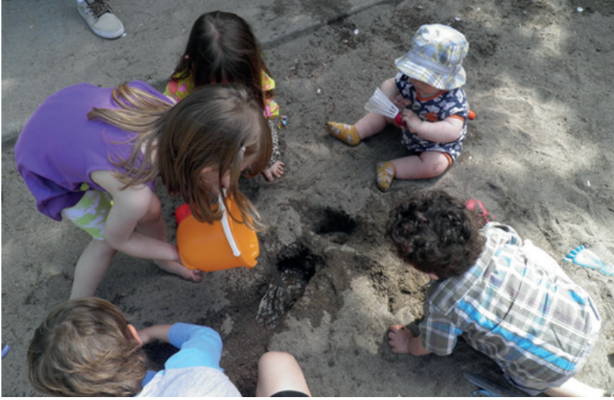
Su ve kum ögelerinin yaratıcı oyun imkanı sunan küçük mahalle parkı. Côte-des-Neiges Mahalle Parkı.