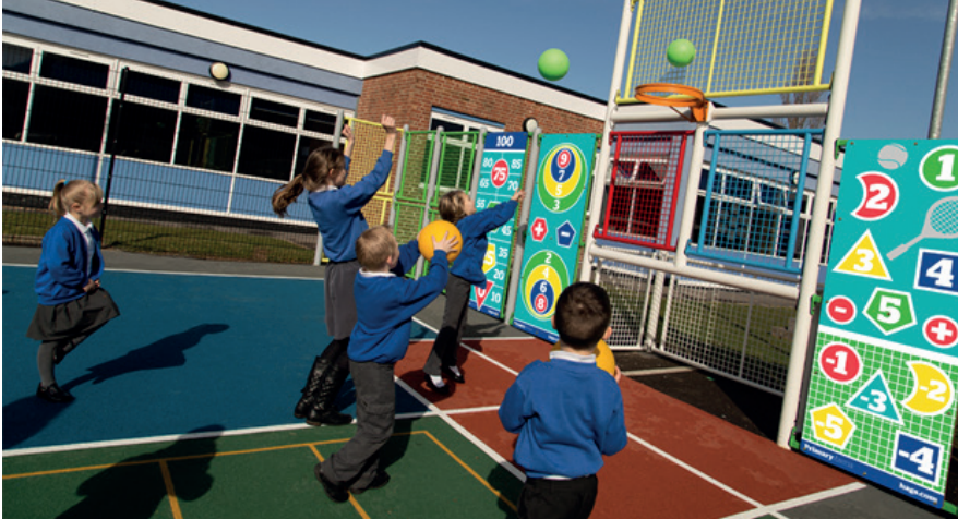
Her yetenekten çocuklar için tasarlanmış kapsamlı, eğitici bir spor sahası, İsveç.