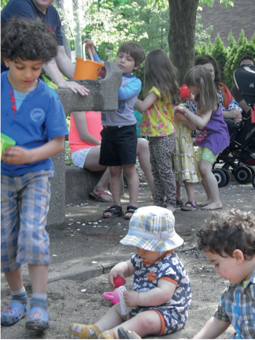
Su ve kum ögelerinin yaratıcı oyun imkanı sunan küçük mahalle parkı. Côte-des-Neiges Mahalle Parkı.