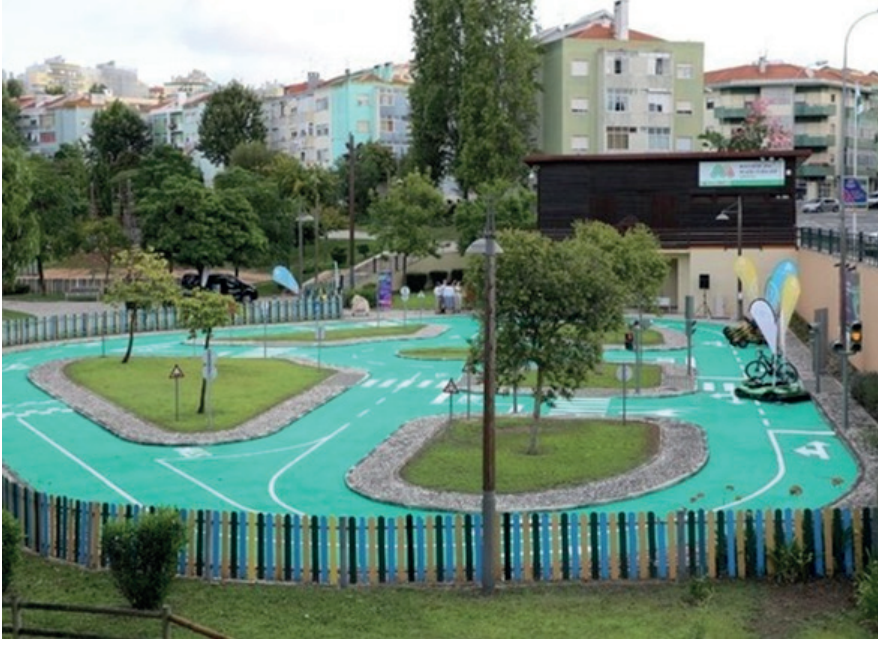
Eğlenerek trafik eğitimi veren tematik park, Amadora, Portekiz.