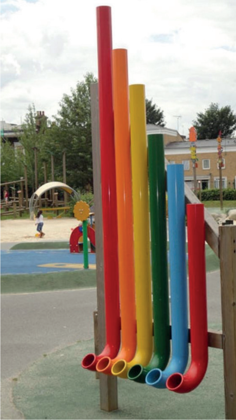
PVC boruları ile mzik yapma imkanı veren bir uygulama.