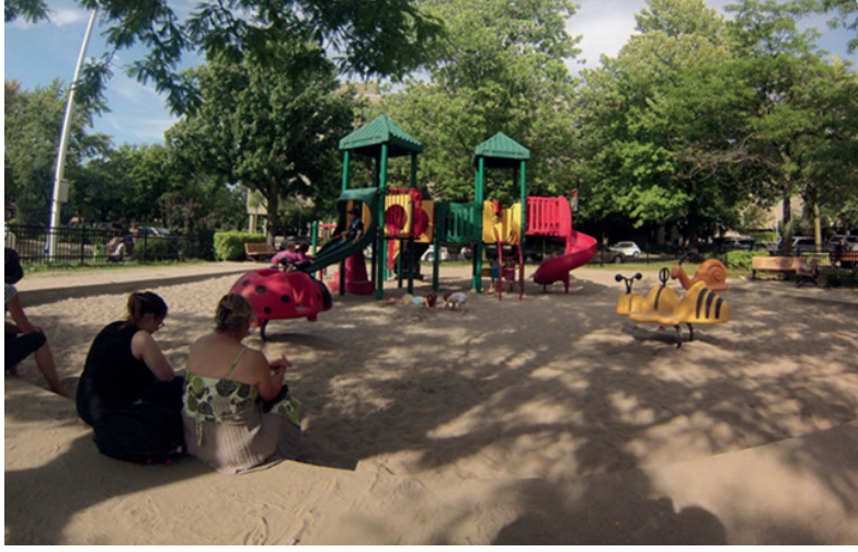
Ebeveynler için enformel oturma alanı. Côté-des-Neiges Mahalle Parkı, Montréal, Kanada.