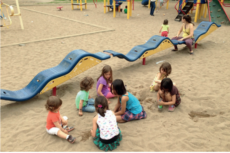
Mahalle parkında sosyal etkileşim. Cotes-des-Neiges Mahalle Parkı, Montréal, Kanada.