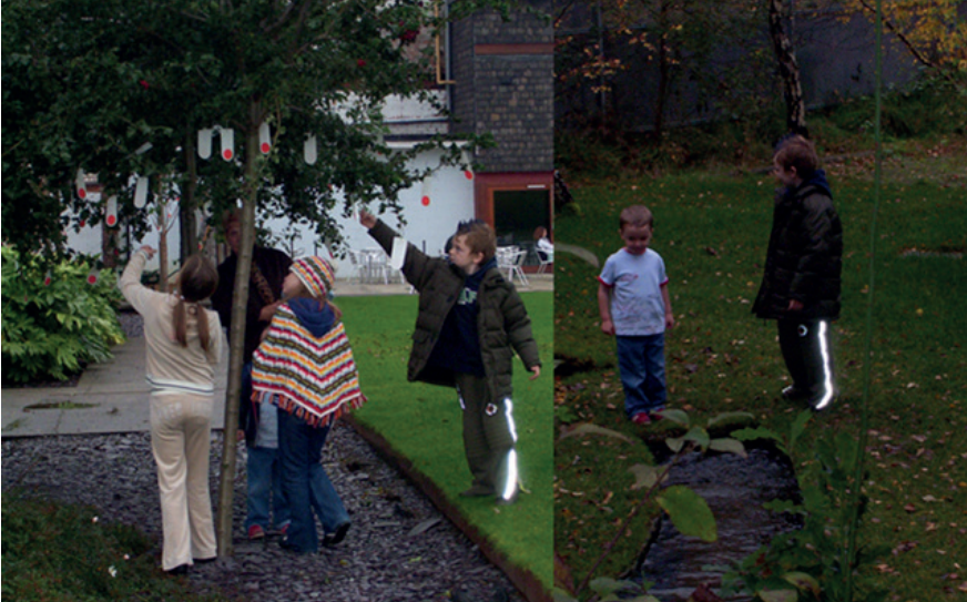
Gözlemlenebilir ve incelenebilir doğal ögeleri ağırlıklı park tasarımı. Oslo, Norveç.