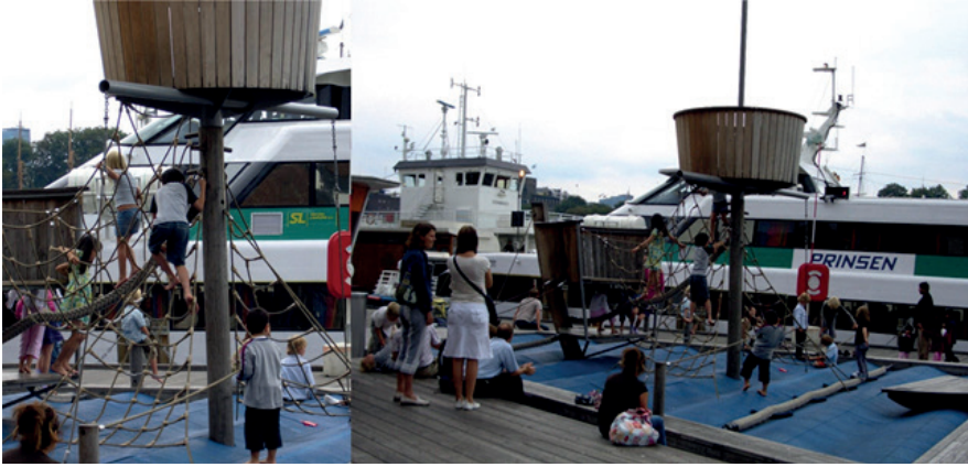
Çeşitli kademeli zorlayıcı faaliyet ve macera oyun fırsatları sunan tematik gemi oyun parkı. Oslo, Aker Brigge, Norveç.