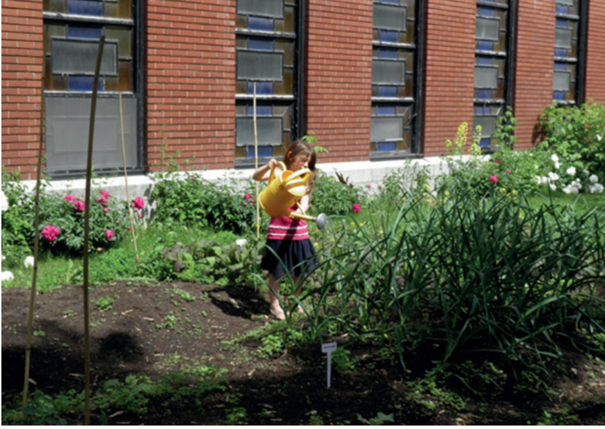
Toplum bahçesi. Côté-des-Neiges, Montréal, Kanada.