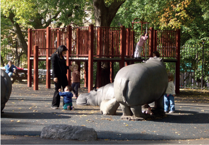
Saklanma, gözlemleme, tırmanma imkanları veren yaratıcı tematik park tasarımı. Hippopotamus Çocuk Parkı, New York, ABD.