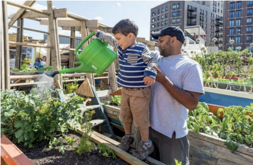
Çocuk için fidan büyütme fırsatı veren toplum bahçeleri, Londra, İngiltere.