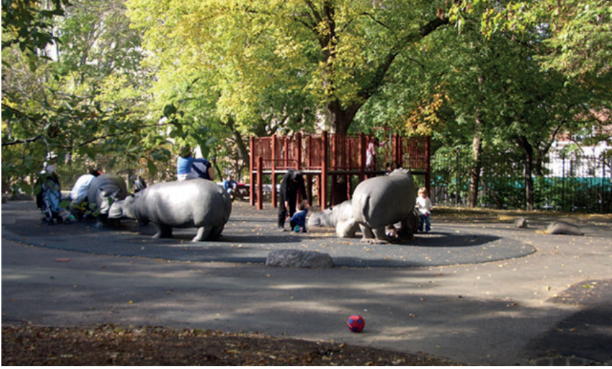
Saklanma, gözlemleme, tırmanma imkanları veren yaratıcı tematik park tasarımı. Hippopotamus Çocuk Parkı, New York, ABD.