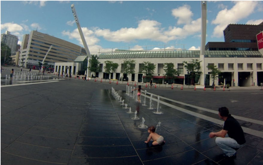
Kent meydanında oyunlu su ögesi ile çocuklara eğlenme alanı. Place des Arts Meydanı. Montréal Montreal, Kanada.