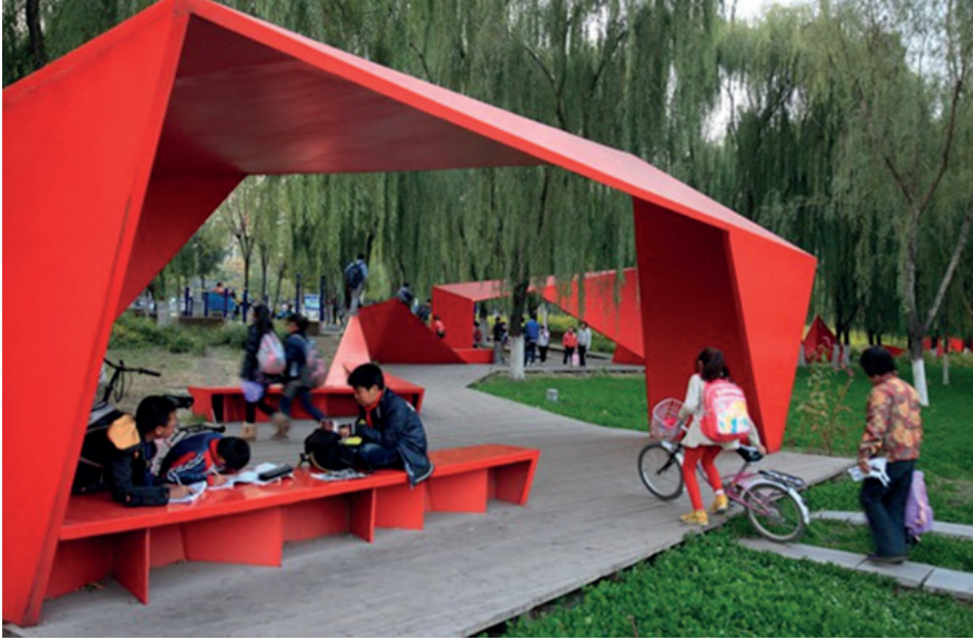
Ekolojik koridorda geometrik biçimleri içeren çocuk oyun alanı, Sanlihe Iрмаđı, Qian, Çin.