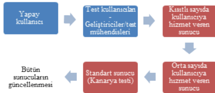
Şekil 1. Örnek bir sürüm değerlendirme süreci.

Sürüm değerlendirme işleminde hedef, sistemin bütünün veya bir bileşeninin yeni bir versiyonu geliştirildiğinde, bu versiyonda yapılan değişikliklerin beklenmeyen etkilerinin olup olmadığını saptamaktır. Bu amaçla, yeni sürüm ve eski sürüm benzer (veya aynı) konfigürasyonlarda çalıştırılır ve sistemlerin ürettikleri metrikler karşılaştırılır (Howard, 2016). Bu değerlendirmede, A ve B versiyonları birbirleri ile karşılaştırıldığı için “A/B testi” adı da verilmektedir (Chatterjee & Simonoff, 2013). Bu değerlendirme etkilenen kullanıcı sayısına göre farklı seviyelerde yapılmaktadır. Bu sıralamada amaç, yeni versiyonun sürülmesini engelleyecek bir durumu olabildiğince az kullanıcıyı etkileyerek saptamaktır. Şekil 1’de örnek bir sürüm değerlendirme süreci verilmiştir. Burada kırmızı kutular ile gösterilen adımlarda, gerçek kullanıcıya hizmet eden sunucular üzerinde değerlendirme yapılmaktadır. Sürüm değerlendirme süreçlerinde, genel olarak en son değerlendirme, en son geçerli sürümün bulunduğu sunucuların konfigürasyonuna benzer bir konfigürasyona sahip sunucu üzerinde yapılır ve buna kanarya testi adı verilir. Bu aşamalardan herhangi birinde bir problem gözlemlendiğinde ileri adımlara geçilmez, sürüm geri çekilir ve sorun kaynağının araştırılması süreci başlatılır. Sistemin özelliklerine ve sürüm güncelleme sıklığına göre bu aşamalardan bir kısmı uygulanmayabilir veya farklı aşamalar eklenebilir.