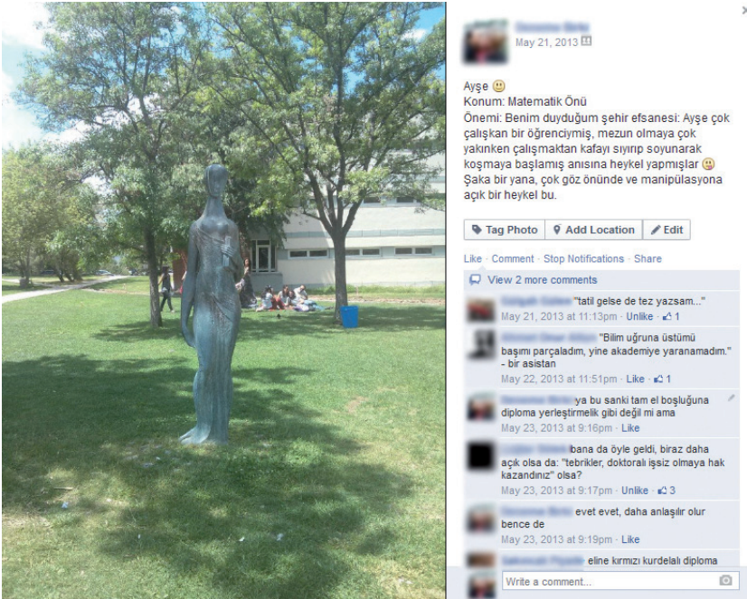
Resim 3. Facebook grubu aracılığıyla içeriklerin kolektif olarak belirlenmesi