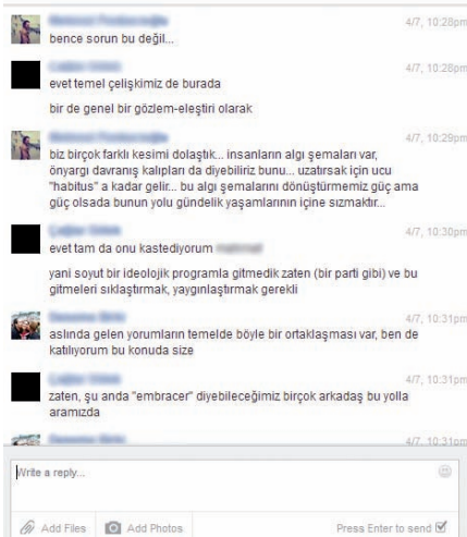
Resim 1. Facebook mesajlaşması aracılığıyla aktörlerin tartışılması