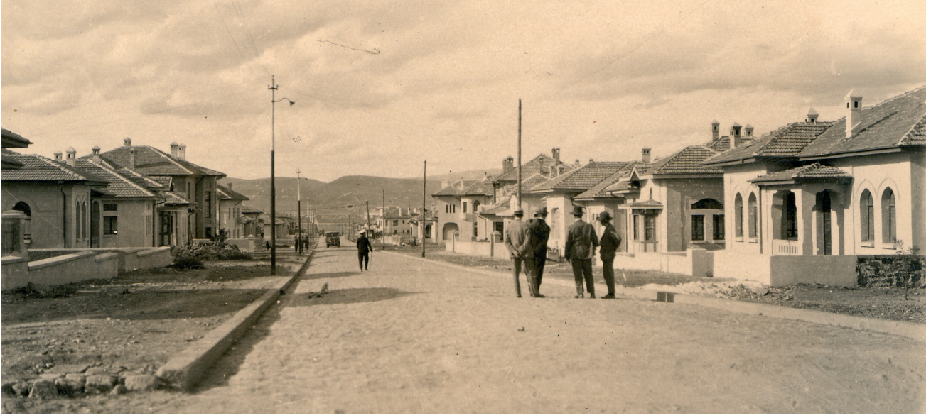
Resim 18. İsmet Paşa Caddesi ortaya çıkıyor: Sağ başta Tip_İsmetpaşa, hemen solunda Tip_Şahnişin, hemen alt parselde Tip_Ulusal. (Cengizkan ve Cengizkan, der., 2019, 208, ATA 111)

destek olması için pek çok tuğla, mozayik, fayans, karosiman, lavabo ve mutfak-banyo-tuvalet taşı imalat atölyesi kurduğunu biliyoruz. Şehir içi araçlar ise at, eşek, kağrı arabası ve kamyonet idi. (Kuruyazıcı, 2008, 236) Kartpostal fotoğraflardan okunduğu kadarıyla kamyonetlerin özellikle yabancı inşaat firmalarınca kullanılması dikkat çekicidir. Bu koşullarda, örneğin yol altyapı malzemesini sıkıştırmak için kullanılan silindir bile, öncü ve uygar bir inşaat aracıdır. ( Resim 19-20 )