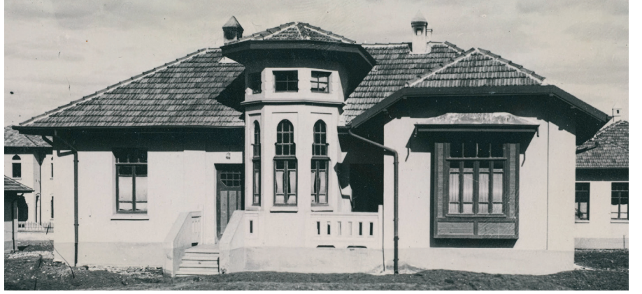
Resim 7. Tip_7 / Kuleli. (Cengizkan ve Cengizkan, der., 2019, 238)