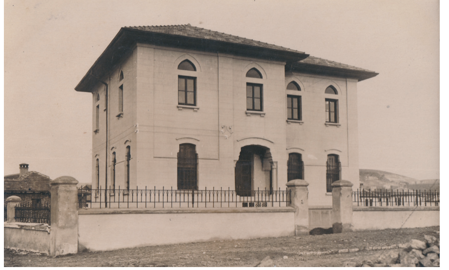
Resim 15. Tip_Yönetici. (Cengizkan ve Cengizkan, der., 2019, 241, KÖA)