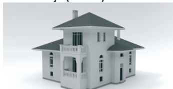
TİP MENEKŞE (4 ADET)