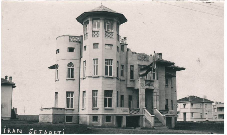
Resim 14. Tip_Uybadin. (Cengizkan ve Cengizkan, der., 2019, 17, ACA)

Giriş cephesi abartılı bir alınlık ile Art-Deco havasındadır; farklı yazarlarca Tek, Mongeri ya da Koyunoğlu mimarlığına atfedilirler. Her katta oldukça büyük metrekare sunan (165m 2 ) dikdörtgenel planlı köşkler, İran, İtalyan, Afganistan ve Macar elçilikleri olarak kullanılmışlardır.