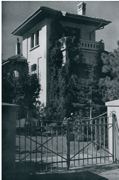
Resim 12. Tip_Menekşe. (ACA 70)

Mustafa Necati Caddesi üzerinde üç adet uygulanmış; Emek İşhanı'nın yerindeki dördüncüsü ise ilk İçişleri bakanlarından Cemil Uybadin tarafından kullanıldığı için Uybadin Köşkü olarak anılmıştır. (GGA) Köşklardan Mustafa Necati Caddesi üzerindeki ikisi, 2021'de ayaktaadır ( Resim 14 ). Planda üç katlı sekizgen kule, dikdörtgen planın giriş cephesine eklenmiştir ve iki katlı genel kütleye cihannüma sunacak biçimde yükselir.