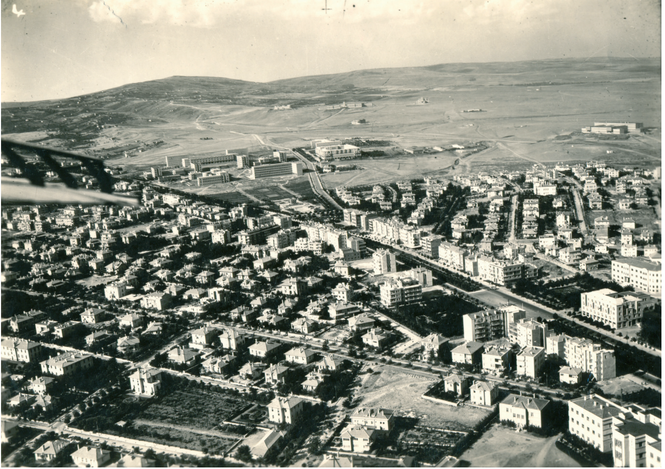
Resim 1. Yeni Şehir'deki yaşam yatırımının algılanır ve tüm hizmet birimleriyle yaşanır kılınması, 1930'ların ilk yarısını buldu. Vekaletler Mahallesi'nin bir bölümü, Atatürk Bulvarı adını alan Lörcher'in Ulus Caddesinin ( Strasse der Nation ) 4 katlı yapılması ve hemen tüm tipleri barındıran bölgenin İsmet Paşa Caddesi, sağ altta Sağlık Bakanlığı, sağ üstte Polis Koleji'ni gösteren, yaklaşık 1940 civarına ait oblik uçuş fotoğrafı (AYA; 22.6cm X 16cm).

de dolaşımında ve etkin olduğunu göstermektedir. Batı dünyasında konut yapımı için üretilen standart tip projeler de, tıpkı Evkaf üzerinden gelen Kemalettin imzalı projeler gibi (Gökçe Günel Arşivi, GGA) yerli-yabancı mimarlar tarafından doğrudan ya da kopyalanarak kullanılmakta; bir görgü oluşturmak için yalnızca mimarın ve müteahhittin elinde değil, yeni "kullanıcı"nın elinde de gezmektedir (26). Mimarlık, belediyenin de teşvikiyle, herkesin katıldığı ve bilip bilmeden karıştığı bir tasarlama ve inşa pratiği olmaya başlamıştır. 1930'lu yılların Yeni Gün ve Muhit dergilerinde yer alacak "popüler mimarlık" ürünlerinin dönemi yaklaşmaktadır (Bozdoğan, 2002, 216-36; Tuncer, 2006).