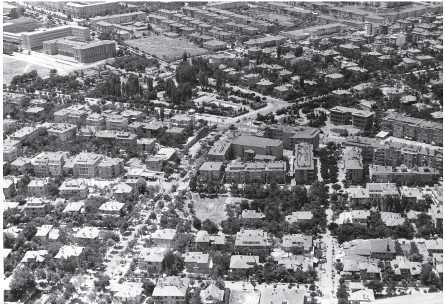
Resim 26. Yeni Şehir dokusu yaşanır durumda; Sakarya Caddesi beliriyor; Atatürk Bulvarı ve Güvenpark; 1940’lı yıllara ait oblik uçuş fotoğrafı. (UKA)

Ama tüm bu özellikleriyle ve farklılaşmalarıyla “Yeni Konut”, modern örgütlenme ile ortaya çıkan, toplumsal örgütlenmesi ve ortakların seçimi planlı; ortak yatırım bütçesi ve ortaklık paylarının bir model içinde düşünüldüğü, modernleşmeden payını alan bir kent konutudur ( Resim 26-27 ). Artık bu özellikleriyle de metalaşmaya açıktır; çünkü ilk tasarımı ve inşaatı öyle olmasa bile, tip kavramı içinden anonim kullanıcıya seslenen modern bir konut olduğunu kısa zamanda kanıtlayacaktır. Plan çeşitliliği,