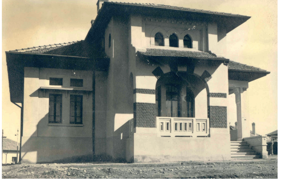
Resim 9. Tip_Zafer. (Cengizkan ve Cengizkan, der., 2019, 236)