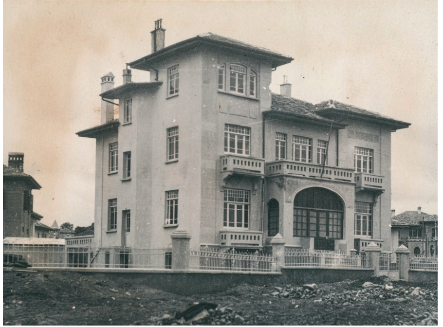
Resim 17. Tip Bektimur. (Cengizkan ve Cengizkan, der., 2019, 239)

29. Yapının farklı dönemlere ilişkin rölöveleri vardır. TBMM Başkanlığı tarafından milletvekili kulübü olarak kullanıldıktan sonra, 2018 yılı sonunda Kültür ve Turizm Bakanlığına devredildi ve Güzel Sanatlar Müdürlüğü tarafından Mustafa Necati Kültür Evi olarak işletildi.