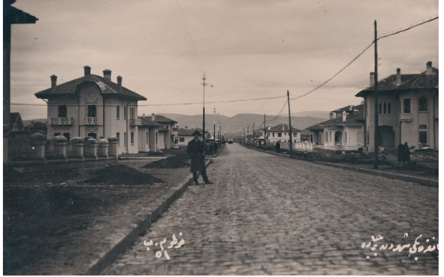
Resim 13. Tip_Mado. (ATA 971)