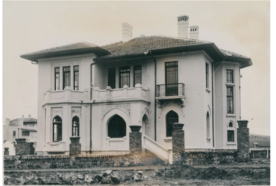
Resim 16. Tip_Konak. (Cengizkan ve Cengizkan, der., 2019, 243)