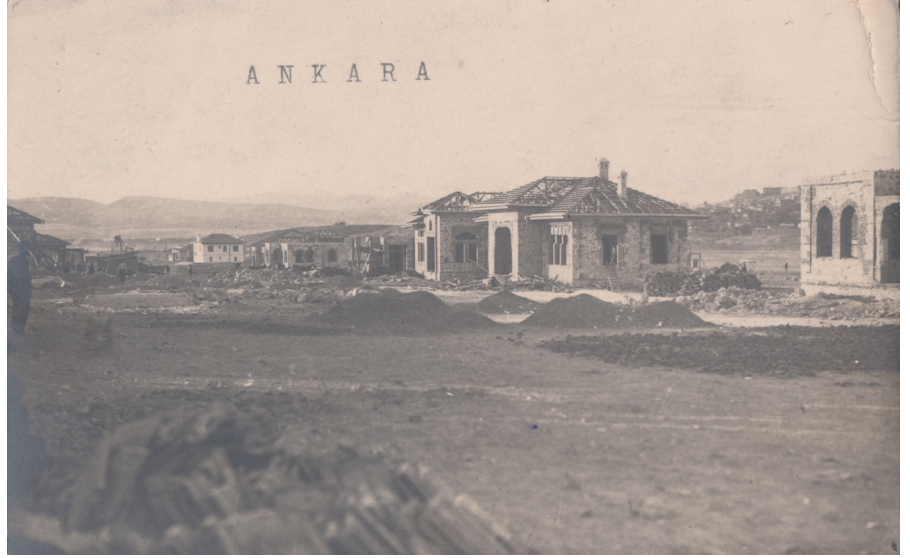
Resim 24. Yeni Şehir dokusu ortaya çıkıyor; İsmet Paşa Caddesi olacak bölgede konutlar yükseliyor. Uzakta, Yeni Şehir'in "ilk konutu", tam merkezde bir "Tip 2. Merkez", tümüyle yapı tektoniğini yansıtarak tamamlanıyor. Erken 1926 yılı. (Cengizkan ve Cengizkan, der., 2019, 196, KÖA Yeni Şehir 16)

üretime, hatalara, düzensizliklere ve özensiz bitişlere yol açabilir. Ahşap iskelelerle betonarme dökümü, harçla taş ya da tuğla duvar örgüsüyle tamamlanmaktadır. Kentin yeni bölgesinin 2-3 katlı inşaatı, inşaat koşullarıyla sınırlanmış ve adeta onun sonucu gibidir.