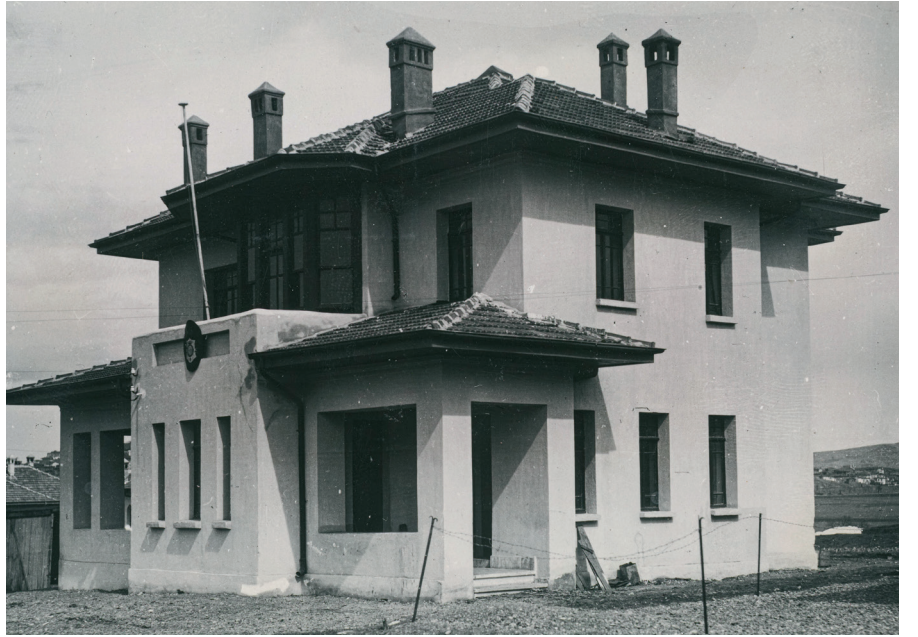
Resim 8. Tip_15 / Verandalı. (Cengizkan ve Cengizkan, der., 2019, 240)

Basık kemerli ön cephe balkon ve arkasındaki iki dikmeyle üçe bölünmüş kemerli açıklık, mimarının Tek olabileceğini düşündürmektedir.