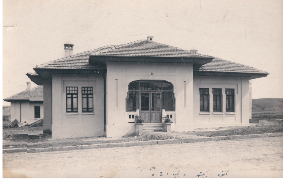
Resim 4. Tip 2/ Merkez. (KÖA 27; ayrıca Cengizkan ve Cengizkan, der., 2019, 236)

27. Planlar üzerinde yer alan Osmanlıca açıklamalar ("Mebusan Evi: Ankara'da inşa olunacak mebus evleri müsabakasına ait. Renksiz teras hesaba dahil değildir") yanı sıra, MOTTO A kodu, bir yarışma katılımı olmasının yanı sıra, belki de yabancı bir mimar tarafından tasarlanmış olduğunu göstermektedir. Plan tipi ve çatı arası odasının kırılımı, bu fikri destekler.