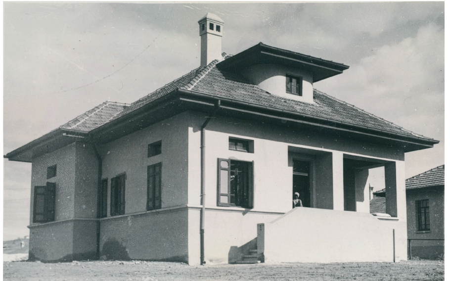
Resim 6. Tip_Kanatlı. (Cengizkan ve Cengizkan, eds, 2019, 238)

Zafer Park civarı ve İsmet Paşa Caddesi üzerinde yedi adet uygulanmıştır. Ana yaşam alanı yükseklikleri 3.50m'den fazla olan ve bütün odalarda pencere tepe açıklıkları (eski deyimle "tepe camı") aydınlatma/havalandırması bulunan yapının ön cephesinde geriye çekilmiş balkon ve giriş terası bulunmaktadır. Evkaf mimarları karakteristikleri taşıyan yapının, tek pafta üzerinde cephe çizimleri bulunmaktadır (Resim 9).