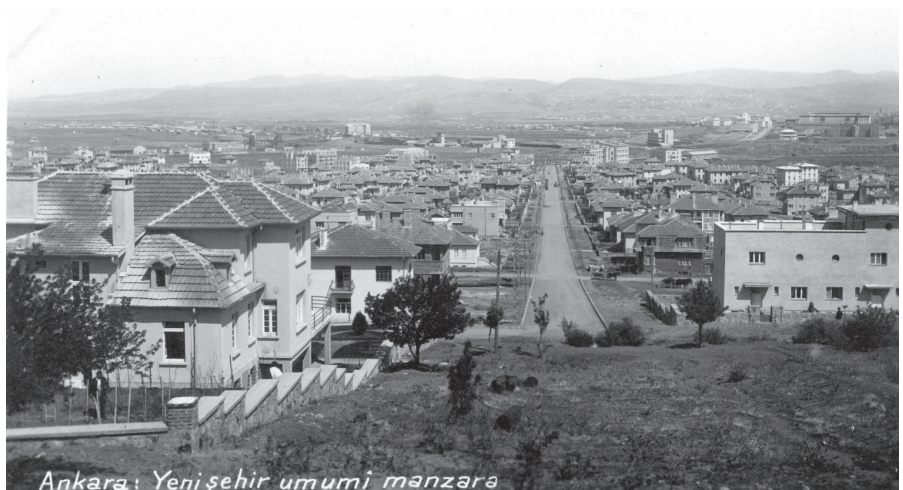
Resim 27. Yeni Şehir Kocatepe (Deliler Tepesi) Su Deposu Parkından İsmet Paşa Caddesi kuzeye doğru uzanıyor. (UKA)