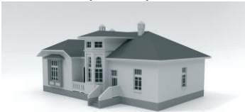
TİP 7. KULELİ (12 ADET)