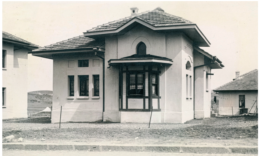
Resim 5. Tip_5 / Şahnişin. (Cengizkan ve Cengizkan, der., 2019, 239)

"Tip 6"; plan ve cephe çizimi elde olan yapı (MAA) Mebusan Evi olarak önerilmiş, 13 birim olarak çoğunlukla Sakarya Caddesi civarında inşa